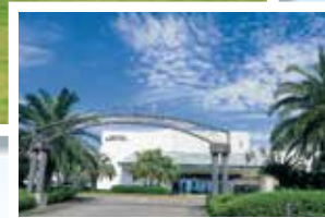
観音崎京急ホテル