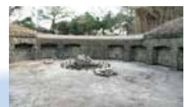
NPO法人よこすかシティガイド協会事務局 ☎ 046-822-8256(9:00~17:00 土日祝日を除く)